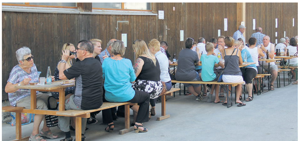
Zahlreiche Besucher nutzten die Gelegenheit einen Blick in die Gebäude zu werfen.

Ansprechperson PR / Marketing: Martin Aue c/o Marketlink Consulting GmbH, Telefon 033 650 10 10, martin.aue@marketlink.ch